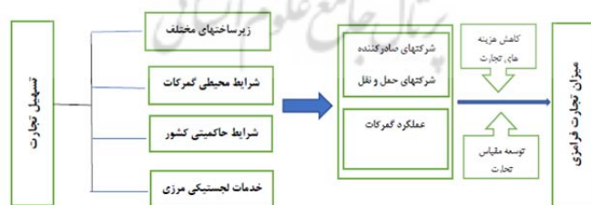
شکل ۲. چارچوب تحلیل مسیر در تجارت فرامرزی

بر این اساس با بهره‌مندی از نظریه هزینه مبادله، یک مدل مفهومی از تأثیر عوامل محیطی تسهیل‌کننده تجارت بر مقیاس معاملات تجارت فرامرزی در شکل (۲) ارائه شده است: