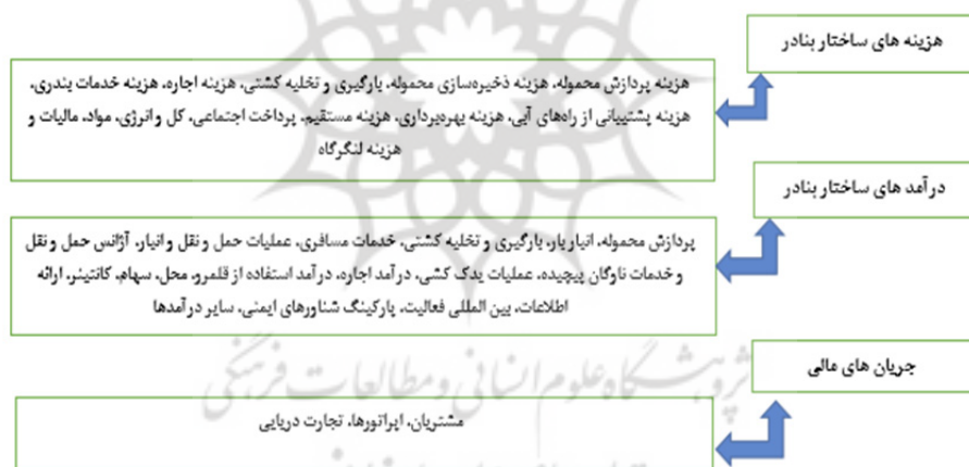
شکل ۱. مدل ارزش افزوده ایجاد شده ناشی از اقتصاد دریا محور در بنادر

در این راستا یکی از رویکردهایی که برای تعیین تأثیر اقتصاد دریا بر تجارت دریایی هر کشور پیشنهاد شده است، رویکرد ارزش افزوده ایجاد شده توسط کلیه بنگاه‌ها یا فعالیت‌های اقتصادی در بنادر تجاری بوده که بر این اساس مدل ارائه شده در شکل (۱) منابع ارزش آفرینی در بنادر تجاری دریایی را نشان می‌دهد (نینو و نیتسنکو (Nyenno & Nitsenko) ۲۰۱۷: ۱۵۷).