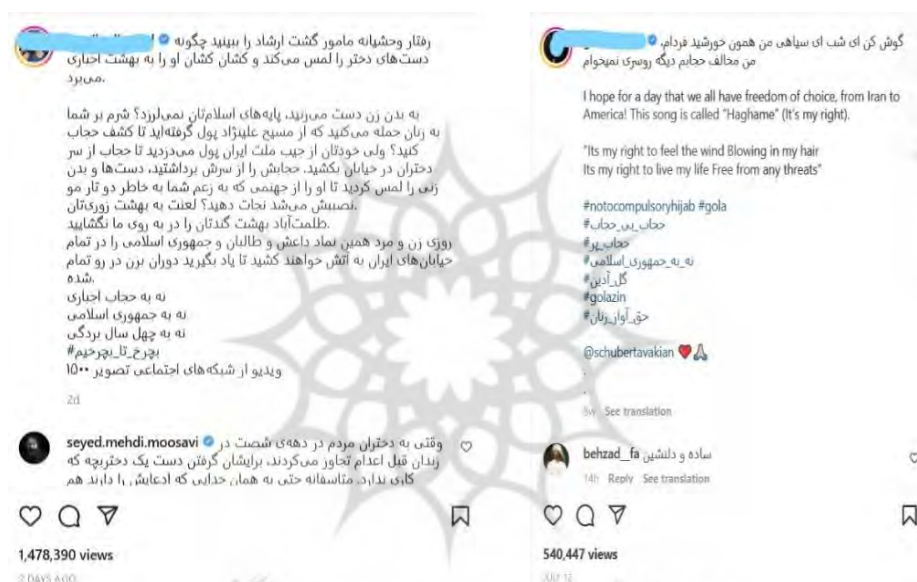
شکل ۳. شبکه‌گاه علوم انسانی و مطالعات فرهنگی

اولین پست در این خصوص «ف م شکل ۲»، به حق آواز زنان می‌پردازد، غالب صفحات فمینیستی که به مسئله‌ی آواز توجه‌ی ویژه‌ای دارند معتقدند در قوانین جمهوری اسلامی قانون صریحی برای منع آواز خواندن زنان وجود ندارد؛ باین حال در طی سال‌های گذشته در چندین دهه هر گونه تک‌خوانی زنان به‌ویژه در صورتی که مخاطب مرد باشد، ممنوع است و در برخی موارد با برخورد دستگاه‌های قضایی مواجه شده است.