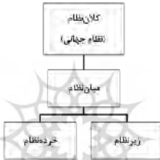
تصویر ۱. طبقه‌بندی نظام‌ها در روابط بین‌الملل

نظام‌پردازی در حوزه روابط بین‌الملل را می‌توان در قالب چهار بخش کلان‌نظام، میان‌نظام، خرده‌نظام و زیرنظام دسته‌بندی کرد (تصویر شماره ۱). در این پژوهش، کلان‌نظام در محدوده نظام فراگیر جهانی تعریف می‌شود؛ میان‌نظام در چهارچوب مرزهای ملی یا نهادهای بین‌المللی است؛ خرده‌نظام و زیرنظام نیز ذیل میان‌نظام قرار می‌گیرند. نظام‌های یادشده هر کدام در بخش‌های مختلف نظام دینی و اعتقادی، سیاسی، اقتصادی و فرهنگی قابل تعریف‌اند و می‌توانند در عرصه روابط بین‌الملل نقش مؤثری داشته باشند.