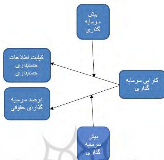
شکل ۱ مدل مفهومی پژوهش