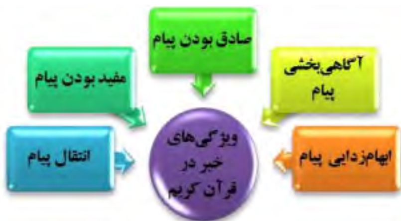
شکل ۱: ویژگی‌های پیام خبری (نبأ) در قرآن کریم

بر اساس آیه‌های قرآن کریم تعدادی از مفاهیم و واژگان، جنبه انتقال پیام دارند، اما فاقد سایر ویژگی‌های خبر حقیقی‌اند. واژگان و مفاهیمی مانند: کذب، تکذیب حق، وسوسه و وعده دروغ، شایعه‌سازی، قسم دروغ، سخن ناآگاهانه و ظنی، افتراء، افک، بهتان، تحریف، تمسخر و استهزاء، اهانت و کتمان حقیقت، گرچه نوعی خبر به حساب می‌آیند، اما چون گویای حقیقت نیستند و از واقعیت حکایت نمی‌کنند، با مفهوم اخبار جعلی و شاخصه‌های آن انطباق پیدا می‌کنند.