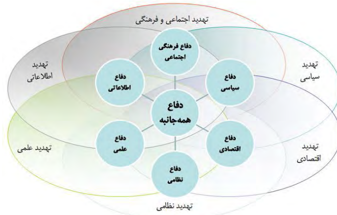
شکل ۱: الگوی دفاع همه‌جانبه