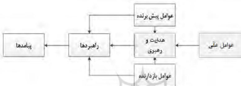
شکل شماره ۲: مدل مفهومی تحقیق (محقق ساخته، ۱۴۰۳)

مدل مفهومی تحقیق با نگرش به اطلاعات گردآوری شده در قالب مدارک (ادبیات تحقیق، اسناد و مدارک)، چارچوب نظری تحقیق برابر شکل زیر ارائه می‌گردد.