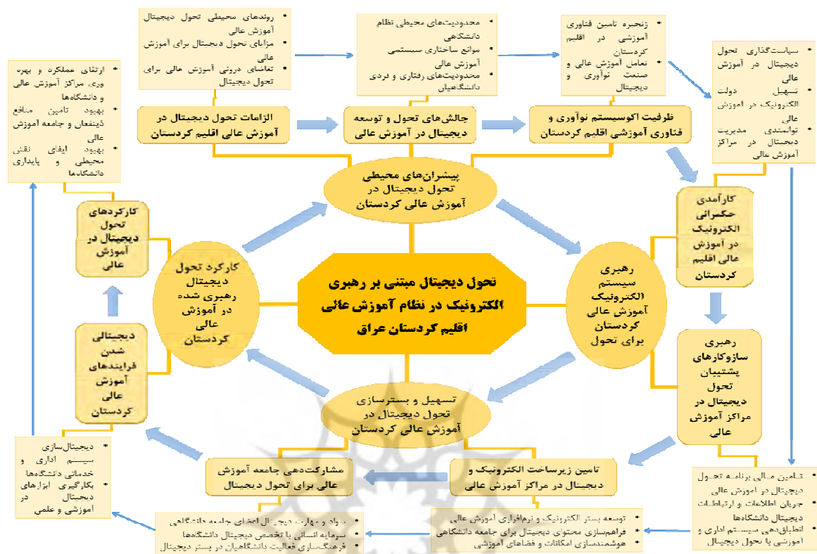
شکل ۱. شبکه مضامین مستخرج از کدگذاری

در نهایت به کارکرد تحول دیجیتال رهبری شده در آموزش عالی کردستان ختم می‌شود. بازخورد و پیامد کارکردها نیز مجدد بر پیشران‌ها اثرگذار خواهد بود.