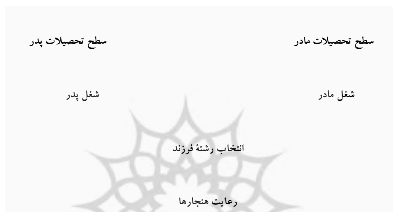
شکل ۲ - رابطه سطح تحصیلات و شغل پدر و مادر و انتخاب رشته تحصیلی

معنی داری نشان داد، برای روشن تر شدن موضوع، نگاه کنید به شکل ۲.