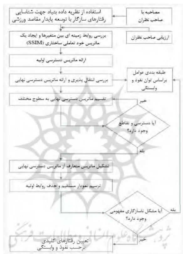
شکل ۱. فرایند ایجاد مدل ساختاری تفسیری

مرحله ۶: تشکیل یک ماتریس متعارف: ماتریس متعارف از طریق گروه بندی عوامل موجود در همان سطح، در سراسر ستون‌ها و ردیف‌های ماتریس دسترسی نهایی ایجاد می‌شود. مرحله ۷: ترسیم نمودار مستقیم و حذف روابط اولیه: بر اساس روابط به دست آمده در ماتریس دسترسی پذیری، یک نمودار مستقیم رسم می‌شود و روابط اولیه حذف می‌شوند.