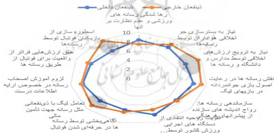
شکل ۳ نمودار عنکبوتی درجه رسانه‌ها از دیدگاه دیدگاه‌های خارجی در برابر داخلی

انتخاب سناریوهای منتخب از رویکرد تحلیل بالانس اثرات متقابل که به اختصار CIB خوانده می‌شود و توسعه‌دهندگان این روش مرکز مطالعات میان رشته-ای ریسک و نوآوری دانشگاه اشتوتگارت آلمان است، استفاده شد. لازم به ذکر است برای تسهیل استفاده از این روش از نرم‌افزار محاسباتی سناریو ویزارد استفاده شد. نرم افزار سناریو ویزارد ابزار کمی‌مورد استفاده این پژوهش است. از این نرم افزار برای تسهیل در پردازش اطلاعات کیفی (نظرات خبرگان)، در پروژه‌هایی که ماهیت میان رشته‌ای دارند و در پروژه‌های آینده نگاری استفاده می‌شود. شیوه کار نرم افزار سناریوویزارد بر مبنای ماتریس‌های تحلیل اثر متقاطع بنا نهاده شده است. این ماتریس‌ها، برای استخراج نظر خبرگان در مورد اثر احتمال وقوع یک حالت از یک توصیف‌گر بر روی حالتی از توصیف‌گر دیگر، در قالب عبارت‌های کلامی‌مورد استفاده قرار می‌گیرد و در آخر با محاسبه اثرات مستقیم و غیرمستقیم حالت‌ها بر یکدیگر، سناریوهای سازگار پیش روی سیستم مورد مطالعه، استخراج می‌شوند.