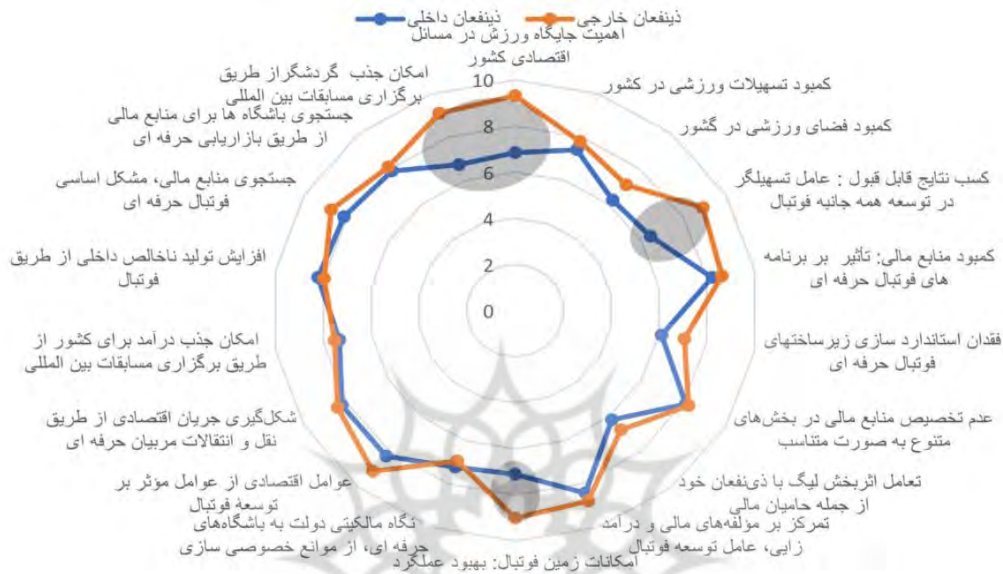
شکل ۵ نمودار عنکبوتی فاکتورهای مالی از دیدگاه دیدگاه‌های خارجی در برابر داخلی

وجود آمده می‌توان خود نقش ویژه‌ای در ممانعت از کج روی‌های حاصل از فوتبال خواهد داشت، در یک نگاه جامع‌تر می‌توان ورزش فوتبال را به عنوان قلب اجتماع نام برد که این توانایی را دارد فرصت‌های بی شماری را از اقتصادی و سیاسی گرفته تا فرهنگی در اجتماع به وجود آورد و در یک سطح بالاتر حتی