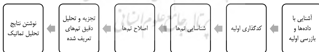
شکل ۱. مراحل تحلیل تم

با توجه به هدف تحقیق (ارائه چارچوب مفهومی قابلیت‌های بازاریابی پویا مبتنی بر تغییرات اقلیمی)، رویکرد پژوهش کیفی است و به لحاظ نوع استفاده کاربردی محسوب می‌شود و ماهیت اکتشافی دارد. در این پژوهش، از تحلیل تم برای تجزیه و تحلیل داده‌ها استفاده شده است. تحلیل تم روشی برای سازمان‌دهی و توصیف داده‌های موجود با شناسایی مضامین اساسی است (براون و کلارک، ۲۰۰۶) و از داده‌ها گزارش کاملاً کیفی، جزئی و ظریف ارائه می‌دهد (براون و کلارک، ۲۰۰۶). ماهیت استقرایی تحلیل تم، به ظهور جهت‌های نظری جدید کمک می‌کند و «راه‌های جدید دیدن» جهان تجربی را فراهم می‌آورد (بانسال، اسمیت و وارا، ۲۰۱۸). این نوع تحلیل به‌ویژه برای مقابله با ساختارهای پیچیده توصیه می‌شود (براون و کلارک، ۲۰۰۶). براون و کلارک (۲۰۰۶) انجام یک تحلیل تم را در شش مرحله پیشنهاد می‌کنند. شکل ۱ این مراحل را نشان می‌دهد.