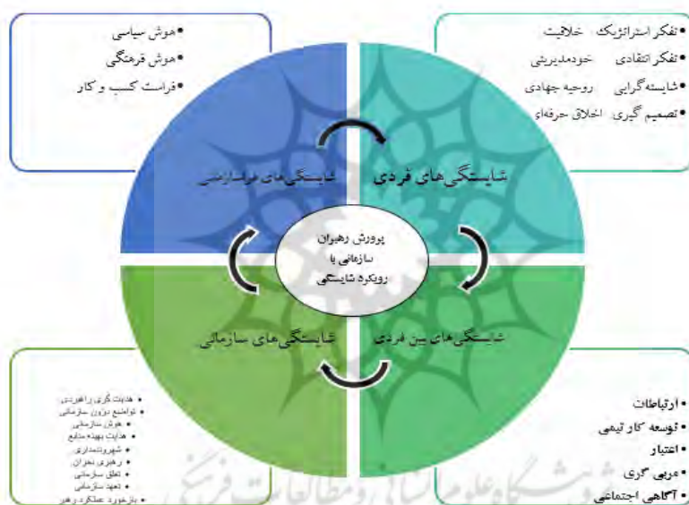
شکل ۲. الگوی پرورش رهبران سازمانی با رویکرد شایستگی

نتایج تحلیل محتوای بخش کیفی در نهایت منجر به استخراج ۴ مؤلفه اصلی شایستگی‌های فردی، شایستگی‌های بین‌فردی، شایستگی‌های سازمانی و شایستگی‌های فراسازمانی؛ ۲۵ ریزمؤلفه و ۱۱۶ شاخص گردید که در جدول فوق ارائه گردیده است و در نهایت مدل پژوهش در قالب شکل شماره ۲ به شرح زیر می‌باشد.