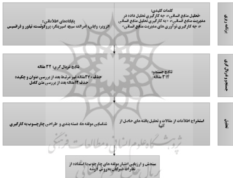
شکل ۱. مراحل انجام تحقیق

انسانی را مفهوم‌سازی کرد. برای شناسایی مقالات مرتبط از طریق پایگاه داده‌ها، کلمات کلیدی زیر به‌عنوان معیار جست-وجو استفاده شدند: «تحلیل منابع انسانی و به‌کارگیری»، «به-کارگیری تحلیل داده در مدیریت منابع انسانی»، «به‌کارگیری تحلیل منابع انسانی». به طور خاص، از آنجاکه هدف تحقیق حاضر ایجاد چارچوبی برای به‌کارگیری تحلیل منابع انسانی بود، فقط آن دسته از مقالاتی بررسی شدند که مشارکت‌های نظری و توسعه آن‌ها بتواند استانداردهای تحقیق حاضر را برآورده کنند. در مرحله نمایه‌سازی؛ مقالات انتخاب‌شده غربال و داده‌ها با استفاده از چارچوب مفهومی اولیه استخراج شدند تا ارتباط آن‌ها با توجه به سؤالات تعیین و ویژگی‌های اصلی آن‌ها شناسایی شود. تمام عوامل و عناصر به‌کارگیری تحلیل منابع انسانی از مقالات شناسایی‌شده، فهرست‌بندی شدند و سپس در مرحله بعدی؛ ترسیم نمودار معنی داده‌های جمع‌آوری‌شده استخراج شدند. در مرحله ترسیم؛ عوامل و عناصر