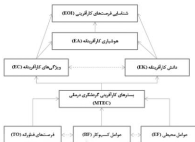
شکل ۳- مدل شناسایی فرصت‌های کارآفرینی در زمینه گردشگری درمانی

(TO) و عوامل کسب‌وکار (BF) در سطح پنج قرار دارند. مدل نهائی سطوح سازه‌های شناسایی شده در شکل سه نمایش داده شده است. در این نگاره تنها روابط معنادار سازه‌های هر سطح بر سازه‌های سطح زیرین و همچنین روابط درونی معنادار سازه‌های هر سطر در نظر گرفته شده است.