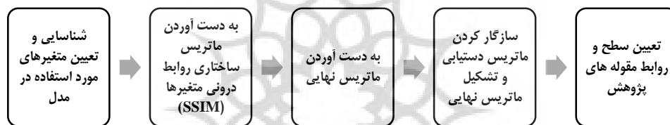
شکل ۲- مراحل اجرای روش مدل‌سازی ساختاری-تفسیری

باشند. همچنین به صورت هم‌زمان جمع‌آوری داده‌ها و تجزیه و تحلیل انجام شده به طوری که بعد از هر مصاحبه، کدگذاری انجام شد و سپس مصاحبه بعدی صورت گرفت. از ارزیابی درونی (مراجعه به آزمودنی‌ها برای تأیید نتایج) و ارزیابی بیرونی (کدگذاری توسط سه نفر از استادان کارآفرینی) استفاده شد و هر سه نفر کدگذاری را مورد تأیید قراردادند. برای پایایی کیفی نیز مصاحبه‌ها ضبط گردید تا تمام موارد مورد بررسی قرار گیرد، بعد از پیاده‌سازی مجدد متن نیز مصاحبه‌ها با صدای ضبط شده شرکت‌کنندگان تطابق داده شد. در طی فرایند کدگذاری از راهنمایی استادان راهنما و مشاور بهره‌برده شده است و در تمام طول فرایند تلاش شد دقت لازم را به کار گرفته شود و ضمن مستندسازی جزئیات پژوهش، از هرگونه سوگیری اجتناب شود (حمزه ئی طهرانی و همکاران، ۱۴۰۱). در بخش کمی پرسش‌نامه مجدداً بین ۱۵ نفر خبره مرحله کیفی توزیع شد و برای سطح‌بندی و تعیین روابط بین مقوله‌های اصلی به دست آمده از بخش کیفی، از روش مدل‌سازی ساختاری - تفسیری بر اساس گام‌های شکل ۲ استفاده شده است (شریف عسکری و همکاران، ۱۳۹۹). سپس تحلیل قدرت نفوذ و وابستگی (MICMAC) انجام داده شد و نمودار آن برای متغیرهای مورد مطالعه ارائه شد.