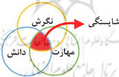
شکل ۱. ترکیب شایستگی از نظر فیلیپوت

همان‌طور که در سند برنامه درسی رشته آموزش زبان و ادبیات فارسی اشاره شده است، دانشگاه فرهنگیان، در عرصه‌های مختلف تربیتی راهبردهای خود را تدارک دیده است تا از طریق آن به شکلی متوازن، معلمانی رشدیافته، دلسوز و حرفه‌ای تربیت کند که به لحاظ کسب شایستگی‌های فردی و جمعی، مراتب قابل توجهی از حیات طیبه را در وجود خویش تحقق بخشند و بتوانند به هدایت و کمک دیگران در شکل‌گیری جامعه سالم و پویانده اقدام