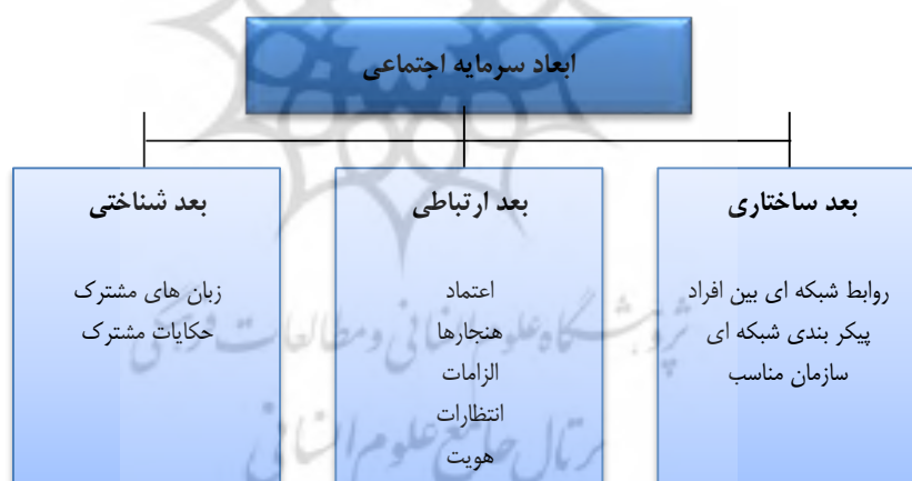
شکل شماره (۱-۲) ابعاد سرمایه اجتماعی از دیدگاه ناهایت و گوشال (حسن زاده پسیخانی و باقرزاده خدشهری، ۱۳۹۷).

✓ حکایات مشترک: اسطوره ها، داستان ها و استعاره ها، ابزار های قدرتمندی در اجتماعات برای ایجاد، تبادل و نگهداری مجموعه های غنی معنای فراهم می کنند (مهاجران و همکاران، ۱۳۹۷: ۴۲).