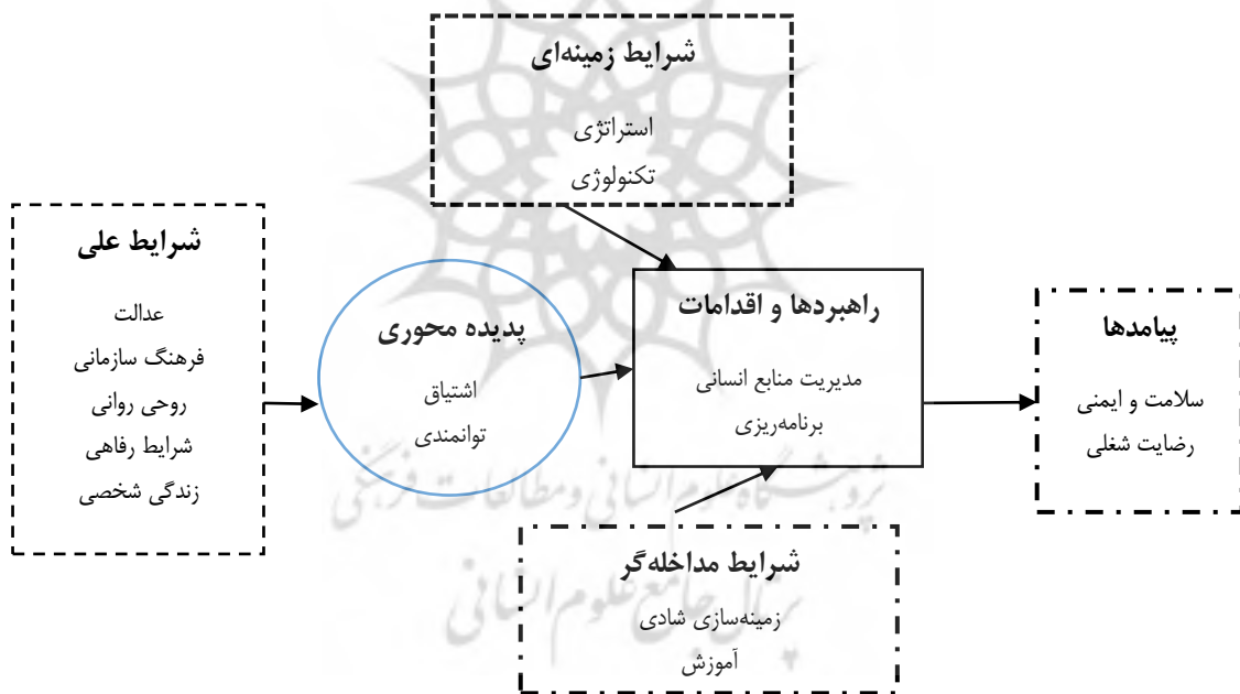
شکل ۱. مدل پارادایمی پژوهش شادی سازمانی

در نظریه‌پردازی بنیادی، تلفیق داده‌ها از اهمیت زیادی برخوردار است. در فرایند پژوهش پس از گردآوری داده‌ها، تجزیه و تحلیل و تفسیر آن‌ها نوبت به ارائه مدل، نتیجه‌گیری و جمع‌بندی پژوهش می‌رسد. در گام اول با بررسی وضعیت موجود، داده‌های به دست آمده در ۱۵ مقوله فرعی طبقه‌بندی