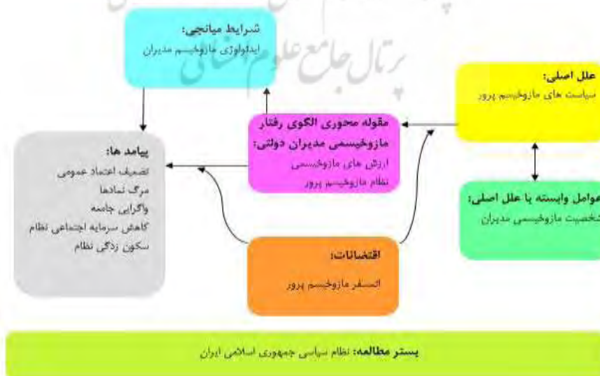
شکل ۲. مدل مفهومی پژوهش