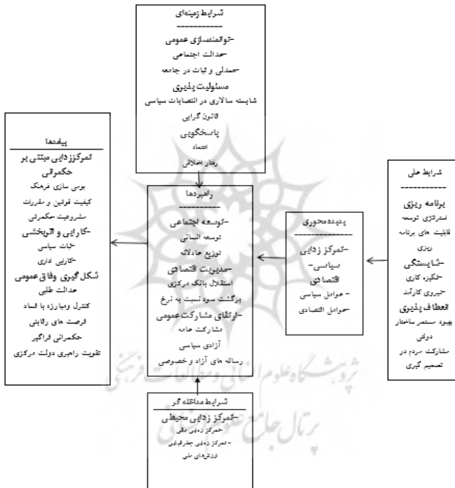
شکل ۱: مدل پارادایمی تحقیق

بر اساس نتایج حاصل از سه مرحله کدگذاری در بخش کیفی پژوهش، داده‌های به‌دست‌آمده در ۹ مقوله اصلی طبقه‌بندی می‌شوند. با نظر استادان و کارشناسان امر، از تمامی شاخص‌های به‌دست‌آمده از تحلیل کیفی ۱۴ مصاحبه، شامل ۹ مقوله و تعداد ۳۰ شاخص جهت تدوین مدل عدم‌تمرکز (سیاسی-اقتصادی) در راستای حکمرانی مطلوب به‌کار گرفته شده است.