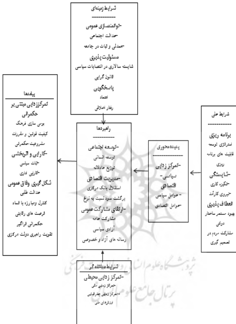
شکل ۱: مدل پارادایمی