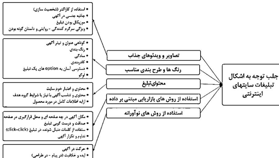
شکل ۱. الگوی عوامل جلب توجه به تبلیغات در سایت‌های اینترنتی