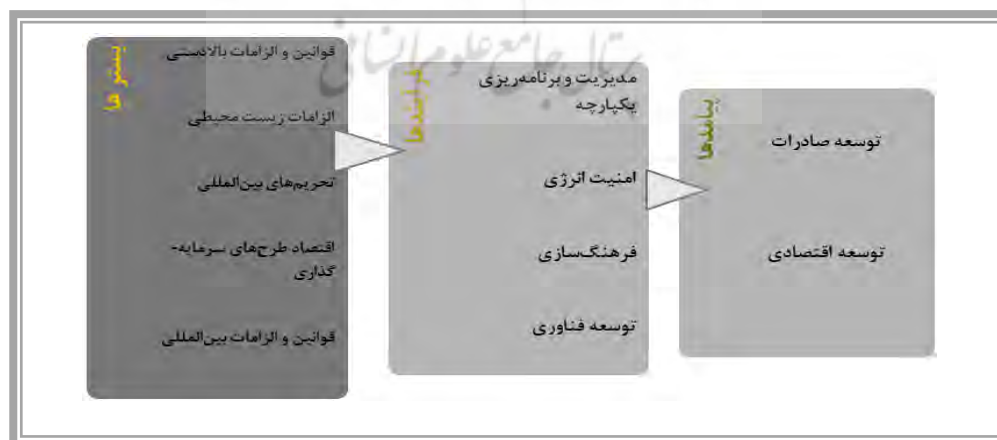
شکل ۱- مدل پژوهش

در مطالعه حاضر برای سنجش اعتبار محتوا از ۱۵ ارزیاب استفاده شد؛ حداقل مقدار قابل قبول CVR با این تعداد ارزیاب بر اساس جدول لاوشه ۰/۴۹ می‌باشد که مقدار CVR برای تمام متغیرها بالای ۰/۴۹ بوده و همچنین شاخص CVI^2 نیز بالای ۰/۷۹ بوده است که نشان از ساده، واضح و مربوط بودن سوالات دارد.