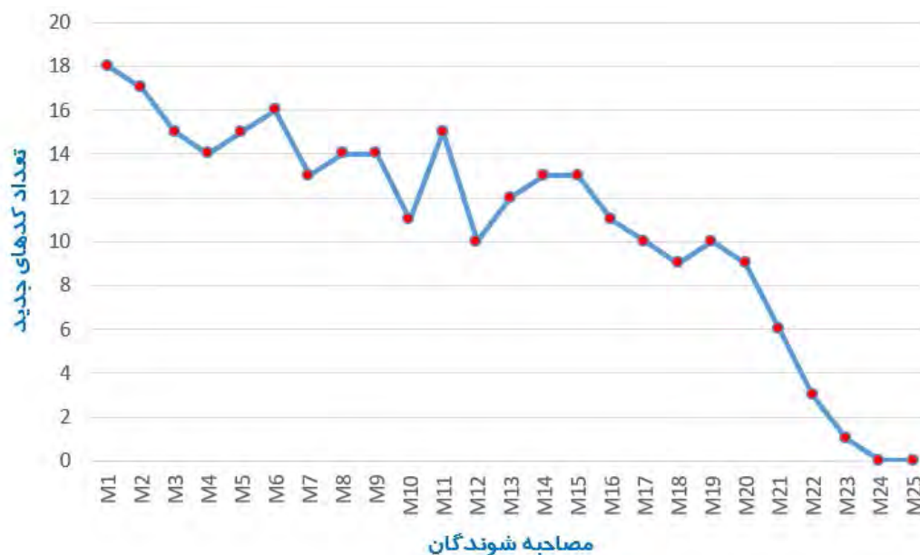
شکل ۱: روند ظهور کدهای جدید در طی فرآیند مصاحبه‌ها