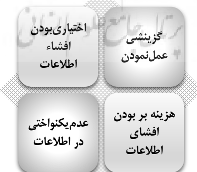
شکل ۱. دلایل عدم اثربخشی گزارشگری پایدار

اما در حال حاضر، با وجود رهنمودها و استانداردهای الگوی گزارشگری جهانی درباره گزارشگری پایداری، رویه جاری گزارشگری با محوریت پایداری در اصل ماهیتی داوطلبانه دارد؛ به گونه‌ای که شرکت‌ها در افشا کردن یا نکردن این اطلاعات آزادند. به عبارت دیگر، در حال حاضر هیچ اجباری برای افشای اطلاعات پایداری در گزارش‌های سالانه وجود ندارد. در پرتو این اختیار عمل، در گزارشگری شرکت‌ها از عناوین زیادی برای توصیف گزارش‌های فعلی از قبیل گزارشگری شهروندی شرکتی؛ مسئولیت اجتماعی شرکت؛ توسعه پایدار، هزینه‌های توسعه پایدار و در نهایت گزارشگری پایداری استفاده می‌شود (کی‌پی‌ام‌جی ۲ ، ۲۰۱۳). نبود قانون برای گزارشگری پایداری باعث ایجاد مشکلات مختلفی نیز شده است. براساس نظر انجمن حسابداران خبره انگلستان و ولز ۳ (۲۰۱۵) مشکلات مذکور عبارتند از: