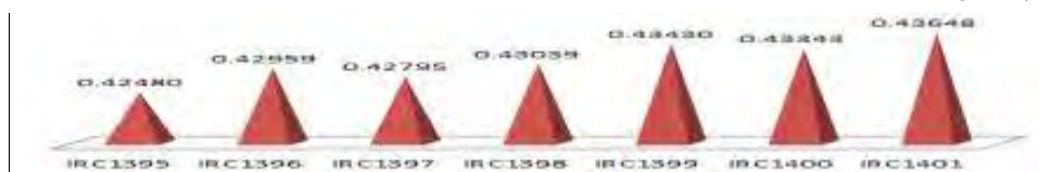
شکل ۱. روند افشای اطلاعات متناسب با عناصر محتوا گزارشگری یکپارچه