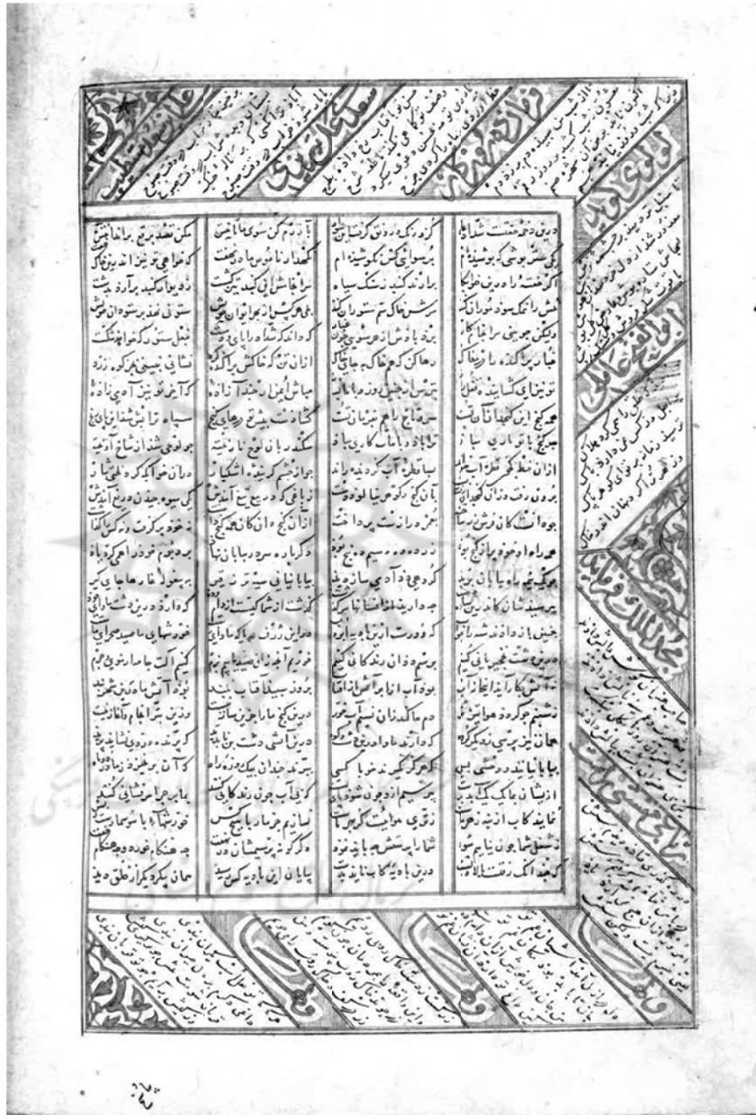
تصویر یک. سفینه اسکندری، دستنویس موزه گلبنکیان، کتابت در ۸۱۳ق، برگ ۲۱۱