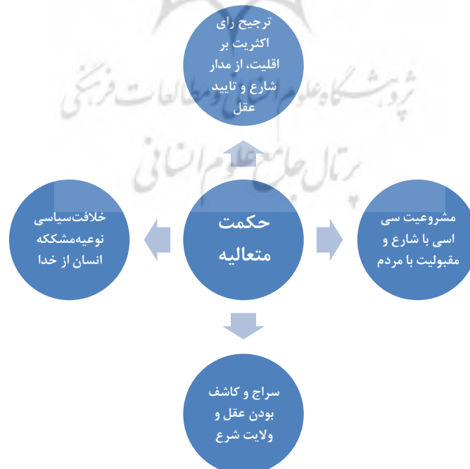
نمودار ۱: تأثیر تفسیر قرآن به قرآن بر کلام‌سیاسی جوادی‌آملی

تأثیر فلسفه اسلامی و حکمت‌متعالیه بر آرا و آثار کلامی و کلامی-سیاسی جوادی‌آملی بسیار گسترده و همه‌جانبه است. به ویژه آنکه او فلسفه را تغذیه‌کننده کلام می‌شمارد. از نظر وی بهترین راه برای تشخیص سره از ناسره، استمداد از مبانی متقن حکمت‌متعالیه است (Javadi Amoli, 2007a: 98). زیرا آن تنها منش فلسفی است که نزدیک‌ترین راه به دین است؛ بلکه در خدمت دین درآمده و تفسیر عقلی آن را به عهده دارد (Javadi-Amoli, 1997: 1-1: 7). از دیدگاه وی از آنجا که حکمت‌متعالیه رئیس همه علوم است (Javadi Amoli, 1997: 1-1: 13). ایستادگی علمی در مقابل شبهات عصر بدون بهره‌برداری و شرح آن دشوار خواهد بود (Javadi-Amoli, 1997: 1-1: 11).