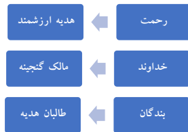
شکل ۲: رحمت گنجینه است

از ابزارآلات مورد استفاده در خانه، به عبارتی کلید، برای عینی سازی این دو مفهوم به کار برده شده است. در نیایش چهلم نیز این مفهوم سازی به گونه عینی تری آمده است: «اجْعَلْهُ بَاباً مِنْ أَبْوَابِ مَغْفِرَتِكَ، وَمِفْتَاحاً مِنْ مَفَاتِيحِ رَحْمَتِكَ» (دعای ۴۰). با این توضیحات، مجموعه تناظرهای نگاشت بالا در شکل ذیل ملاحظه می شود: