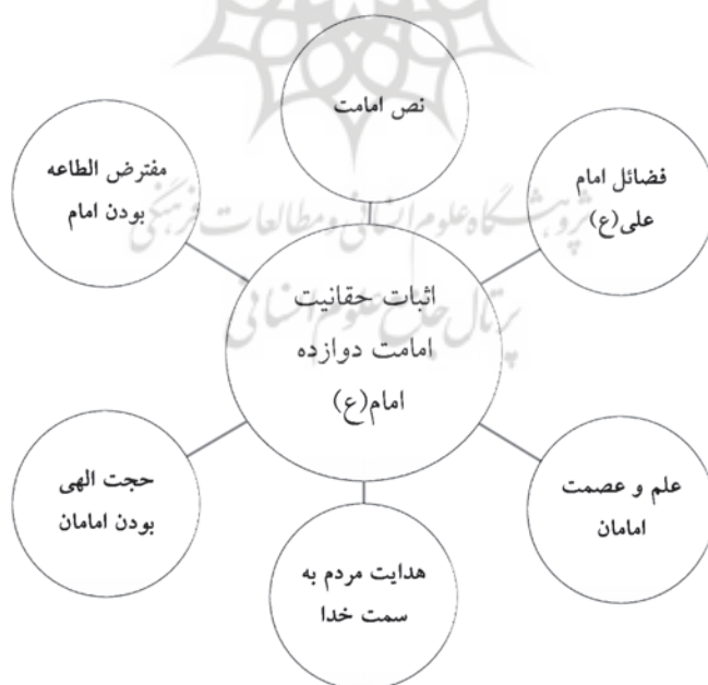
شکل ۱: مولفه‌های محوری روایات امامت امام رضا (علیه السلام)

است. در این روایات که امام رضا به نقل از پیامبر ﷺ بیان کرده‌اند، شیعیان به سبب پیروی از ائمه شایسته کسب فضائلی مانند رستگاری، مورد شفاعت حضرت رسول قرار گرفتن، مورد آموزش و بخشش قرار گرفتن، عبور از صراط، سیراب شدن از حوض کوثر می‌گردند (نک: ابن بابویه، ۱۳۹۵ق، ج ۱: ۲۶۰-۲۶۱؛ طبری آملی، ۱۳۸۳ق: ۱۲۵-۱۲۶). این در حالی است که دشمنی نسبت به اهل بیت (علیهم السلام) دشمنی با خدا و پیامبر، کفر، آتش، نفاق و لعن و غضب الهی را به دنبال خواهد داشت (ن.ک: ابن بابویه، ۱۴۱۳ق، ج ۴: ۴۱۸-۴۱۹؛ ابن بابویه، ۱۳۷۸ق، ج ۲: ۶۰، ۶۳؛ مجلسی، ۱۴۰۳ق، ج ۲۷: ۲۹، ج ۳۹: ۳۲). به نظر می‌رسد این احادیث امام رضا (علیه السلام) در مقابل جریان‌های اهل حدیث و عثمانیه است. نیز می‌تواند ناظر به اختلاف علویان با امام هشتم (علیه السلام) و اطاعت نکردن آنان از امام (علیه السلام) باشد همچون اختلاف مالی یکی از فرزندان امام موسی کاظم (علیه السلام) با امام رضا (علیه السلام) (ن.ک: کلینی، ۱۴۰۷ق، ج ۱: ۳۱۶-۳۱۹؛ ابن بابویه، ۱۳۷۸ق، ج ۱: ۳۳-۳۷). در ادامه برای درکی انضمامی‌تر از نسبت تنوع موضوعی احادیث امام رضا (علیه السلام) در باب امامت با فضای تاریخی هم‌عصر ایشان، نموداری در خصوص مولفه‌های امامت در کلام ایشان (شکل ۱) و همچنین جدولی راجع به مقایسه میان عقاید فرق و مذاهب (در اواخر قرن دوم و اوایل قرن سوم) در باب امامت با احادیث امام (علیه السلام) پیرامون این موضوع (جدول ۱) آمده است.