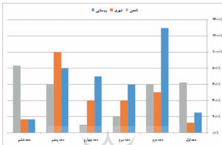
نمودار ۲: فراوانی وقف‌رقات شهری و روستایی

همان‌گونه که نمودار ۲ نشان می‌دهد، دهه ۱۳۳۰ تا ۱۳۴۰ (دهه چهارم) رقبات روستایی نسبت به شهری همچنان بیشترین فراوانی را دارد. در دهه ۱۳۴۰ تا ۱۳۵۰ نوع وقف‌های شهری پیشی می‌گیرد؛ بنابراین می‌توان نظر کارشناسان را تأیید کرد.