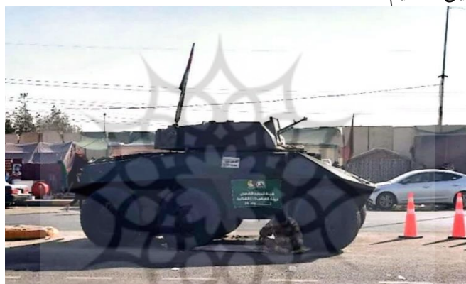
(تصویر از نگارنده، اربعین ۱۴۰۳ ش)

معمول می‌تواند شامل افرادی باشد که دست به بزه‌های خرد و کلان می‌زنند و یا دچار تنش‌های بین فردی بر سر موضوعات مختلف می‌شوند. از سوی دیگر، برگزاری مراسم پیاده‌روی اربعین، همواره ۱ در معرض تهدیدهای گروه‌های بالقوه و بالفعل معاند و مخالف این تجمع بوده (مشخصاً گروه‌های تکفیری و داعش) و لذا ایجاد و حفظ امنیت در کنار برقراری نظم در طی برگزاری این آیین، اهمیتی مضاعف داشته است. بر همین اساس، در تمامی راه و خصوصاً در قسمت مسیر داخل شهر کربلا تا رسیدن به بین الحرمین، شاهد حضور متعدد نیروهای نظامی و انتظامی عراقی به همراه ادوات جنگی سبک و سنگین هستیم.