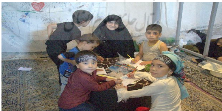
(اربعین ۱۴۰۳ ش)

برپاکنندگان مراسم پیاده روی اربعین از نیازهای فرهنگی و تفریحی زائران حاضر در مسیر غفلت نکرده و درصدد برطرف کردن آنها برآمده اند. از جمله برپایی موکب های فرهنگی که در آن انواع آموزش ها و سرگرمی ها برای کودکان و نوجوانان ارائه می شود. آموزش ها و سرگرمی هایی که در قالب انجام بازی های گوناگون، نقاشی و رنگ آمیزی صورت می گیرد. در کنار اینها، برای غنا بخشی اوقات استراحت و کیفیت گذر زمان زائران، از نمایش فیلم و پخش کلیپ های مذهبی و صوت های سخنرانی و مداحی در مسیر پیاده روی و در میانه برخی از موکب ها، بهره برده می شود.