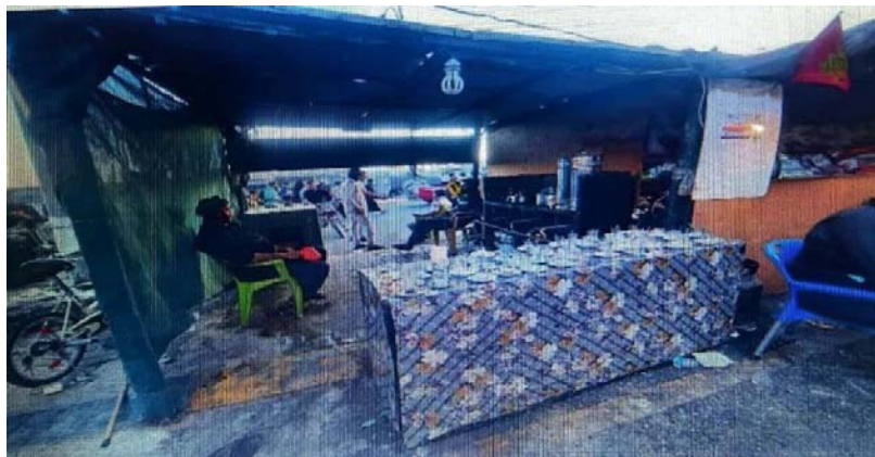
(تصاویر از نگارنده، اربعین ۱۴۰۳ ش)