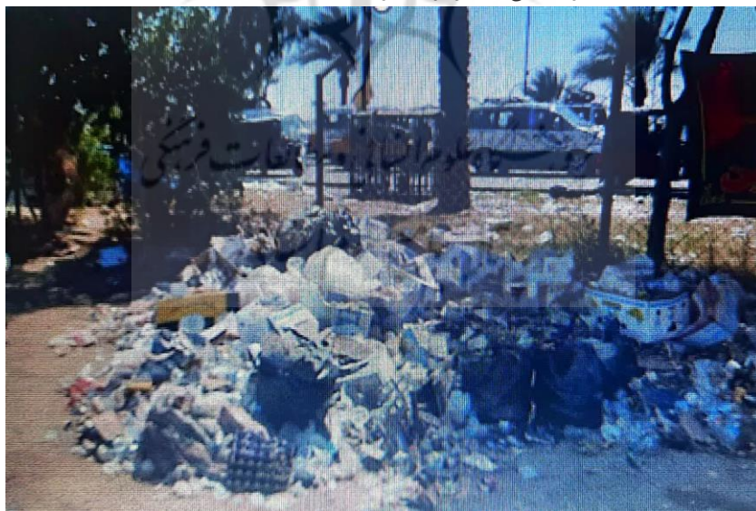
(تصویر از نگارنده، اربعین ۱۴۰۳ش)

تولید زباله‌های فراوان یکی از آسیب‌های جدی در طی برگزاری آیین پیاده‌روی اربعین است. چنانچه، با وجود تلاش زیاد نیروهای خادم حاکمیتی و مردمی عراقی و ایرانی، همچنان و به صورت دائمی، تل‌هایی از زباله در مسیر پیاده‌روی مشاهده می‌شود. در این میان، استفاده از ظروف یکبار مصرف که در چند سال اخیر استفاده از آنها افزون شده، مشکلات زیست محیطی عدیده‌ای را نیز به دنبال داشته است. رها سازی انبوهی از ظروف یکبار مصرف که برای محیط زیست اثرات مخرب جبران‌ناپذیری دارد، یکی از بارزترین آسیب‌های شکل گرفته در زمان برگزاری آیین است که باید مورد توجه جدی همگی نهادها، ارگان‌ها و نیروهای مردمی (چه خادم و چه زائر) کشورهای میزبان و مهمانان حاضر در این مسیر قرار گیرد.