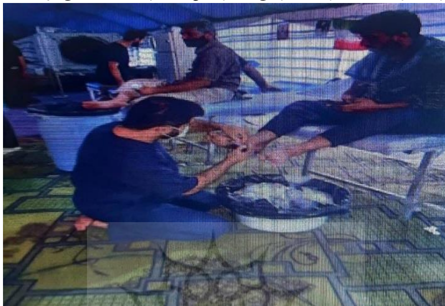
(تصویر از نگارنده، اربعین ۱۴۰۳ش)

عراق و ایران، در کنار گروه‌های مردمی حاضر از این دو کشور، مهیا و ارائه می‌شود.