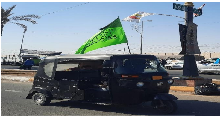
(تصویر از نگارنده، اربعین ۱۴۰۳ ش)

موتورهای سه چرخ، تعداد زیادی از گاری های دستی، خصوصا در اطراف بین الحرمین، جهت سوار کردن و نقل و انتقال زائران خسته از راه وجود دارد.