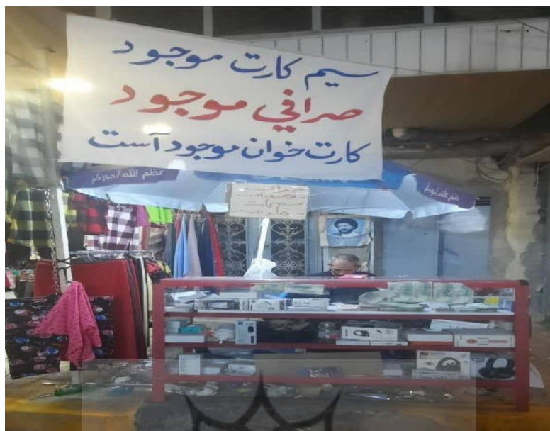
(تصویر از نگارنده، اربعین ۱۴۰۳ش)