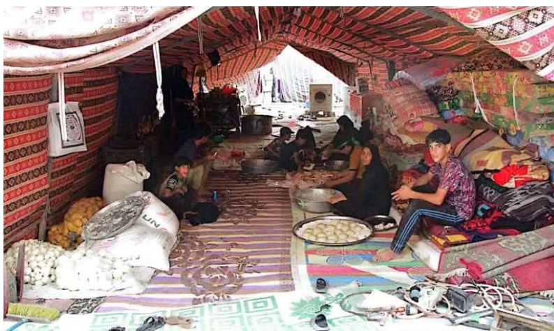
(تصویر از نگارنده، اربعین ۱۴۰۲) ۱