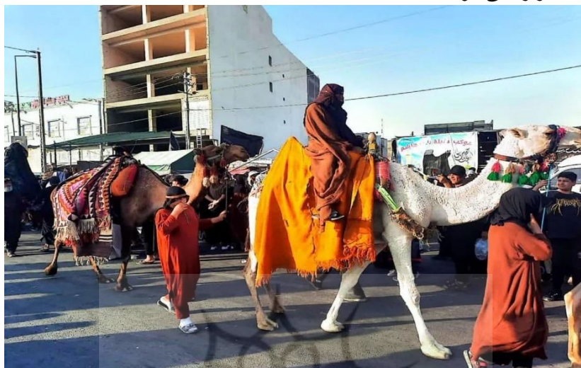
(تصویر از نگارنده، اربعین ۱۴۰۲ ش) ۱

مشغول شود. گاهی نیز به زبان ترکی و به ندرت به لهجه‌های دیگر، مراسمات عزاداری در موکب‌ها برگزار می‌شود.