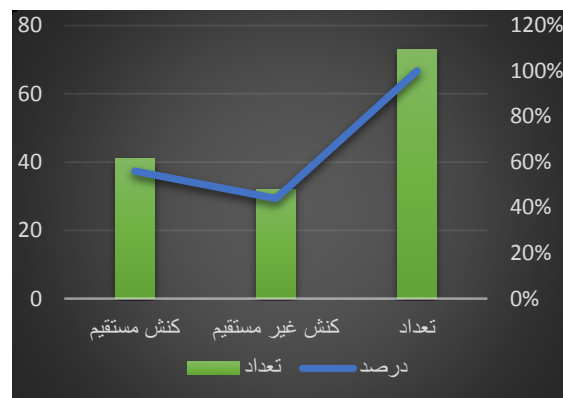
نمودار ۲ بسامد کنش‌های گفتار مستقیم و غیر مستقیم در ادعیه قرآنی

- دومین کنش به کار گرفته شده که بسامد بالایی در آیات قرآنی دارد، کنش اظهاری است. این کنش با بسامد (۲۲) مورد و معادل (۳۱٪) آمده است. قصد و هدف پیامبران روشنگری از اوضاع و احوال خویش است. بیان شرح و تفسیر جزئی از کنش اظهاری در ادعیه پیامبران محسوب می‌شود؛ بنابراین، کنش گفتاری در مقایسه با کنش ترغیبی صریح و با راهبرد مستقیم به کار رفته است.