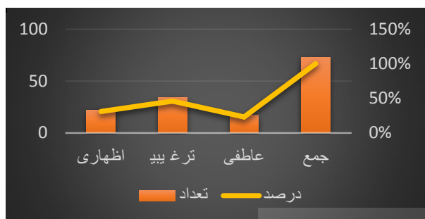
نمودار ۱: بسامد کنش‌های گفتار در ادعیه پیامبران در قرآن کریم

از جدول و نمودار بالا چنین برمی آید که ادعیه پیامبران در قرآن کریم شامل انواع کنش‌های گفتاری است. از بین پنج کنش یادشده در نمونه سرل در نظریه کنش‌های گفتار فقط سه مورد آن یعنی کنش اظهار، کنش ترغیبی و کنش عاطفی بررسی شد که هر کدام جلوه و وظیفه خاصی به زبان به کار گرفته شده در آیات می دهند. این کنش‌ها گاهی به صورت کنش مستقیم منظور صریح و ضمنی پیامبران را متجلی می کنند و گاهی نیز به صورت غیرمستقیم منظور پیامبران در ضمن کنش‌ها قرار می گیرند. آمار زیر بسامد کنش‌های مستقیم و غیرمستقیم را در آیات مورد بحث نشان می دهد: