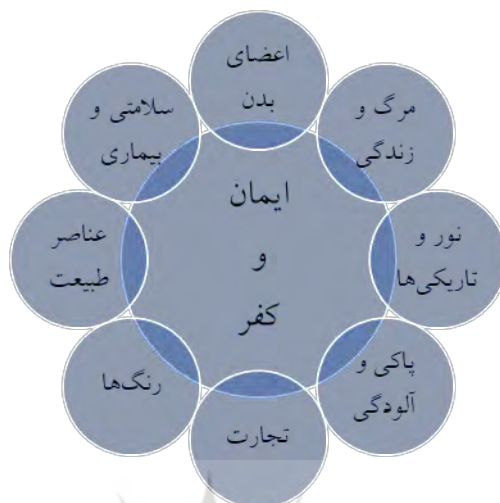
۱. حوزه‌های مبدأ ایمان و کفر در قرآن کریم