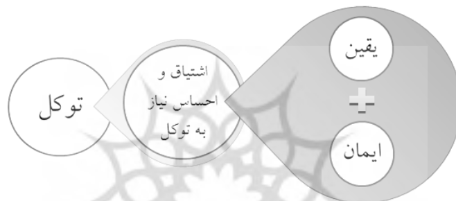
شکل ۱: رابطه توکل با ایمان و یقین

انجام آموزش به خدا اعتماد می‌کند و آموزش را به او می‌سپارد. وجود مرحله احساس نیاز بین پیدایش ایمان و یقین تا تحقق توکل نیز دلیلش روشن است؛ زیرا پیش از اراده هر فعلی توسط انسان، ابتدا باید احساس نیاز به انجام آن کار در او پیدا شود و سپس به انجام آن مبادرت ورزد. به عبارتی، صدور توکل وابسته به اراده انسان است و آن نیز پس از احساس نیازی که وابسته به ایمان و یقین است، حاصل می‌شود. ۱ در نتیجه، انسان با ایمان و یقین به قدرت پروردگار و ناتوانی خود در برابر امور مختلف، این زمینه در نفس او پیدا می‌شود تا آموزش را به خداوند متعال بسپارد.