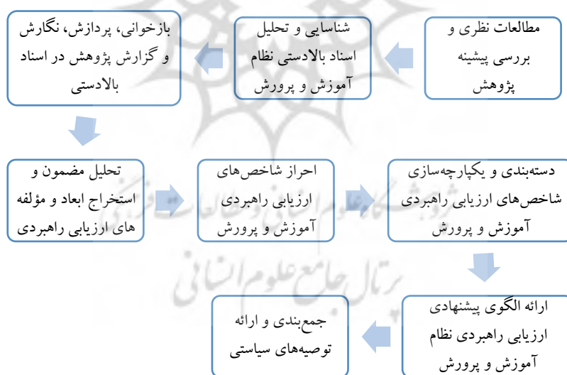
نمودار ۱. نقشه عملی پژوهش

در این پژوهش مبتنی بر روش مطالعات اسنادی و تحلیل مضمون، فرایند زیر جهت احصای ابعاد، مؤلفه و شاخص‌های ارزیابی راهبردی نظام آموزش و پرورش جمهوری اسلامی ایران به انجام رسیده که قابل مشاهده است: