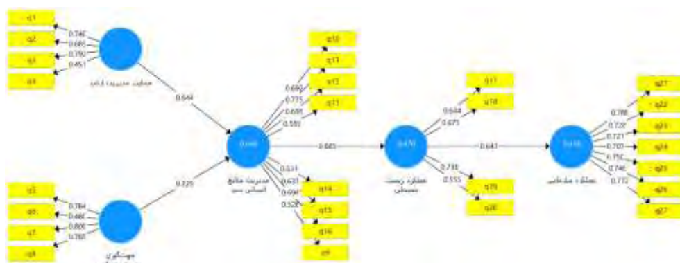
شکل ۲: مدل ساختاری برازش یافته در حالت ضرایب استاندارد

مطابق با جدول ۲، مقدار جذر AVE (قطر اصلی ماتریس) تمامی متغیرها از مقدار همبستگی میان آن‌ها بیشتر است که این امر روایی و اگرای مناسب و برازش خوب مدل اندازه‌گیری را نشان می‌دهد. در ادامه، نتایج حاصل از تکنیک معادلات ساختاری جهت بررسی الگوی ساختاری روابط و برازش آن توسط نرم‌افزار پی.ال.اس ارائه شده است.