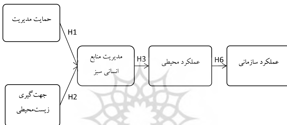
شکل ۱: مدل مفهومی پژوهش (اوبیدات و همکاران، ۲۰۲۰)