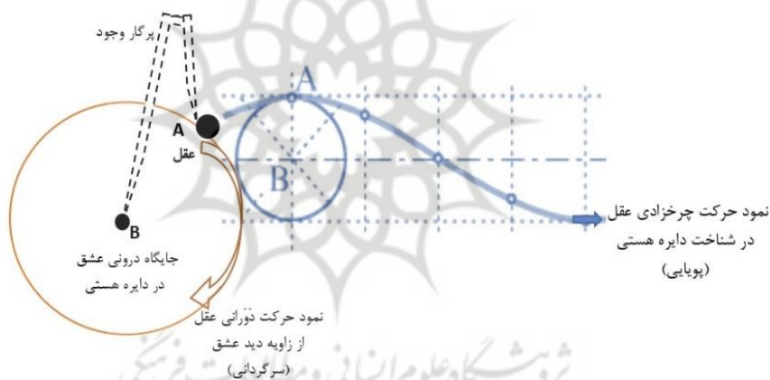
شکل ۱ طرح تحلیلی جایگاه شناختی عقل در ارتباط با عشق (دل) در عالم وجود

برداشت عمقی‌تری از این دیدگاه حافظ که «عقلان نقطه پرگار وجودند ولی / عشق داند که در این دایره سرگردانند» منظری دیگر از حرکت عقل را در عالم وجود به نمایش می‌گذارد: چنانچه نقطه‌ای بر روی دایره به حرکت بر روی خط راست درآید، مسیری چرخ‌زاد (سیکلوئید) را طی می‌کند، که در ریاضیات مباحث مربوط به خودش را دارد. نکته جالب توجه در برداشت حافظ از جایگاه عقل و عشق (دل) این است که از زاویه دید درونی دایره، عقل حرکتی سرگردان به دور دایره دارد. ولی از زاویه دید بیرونی (نسبت به دایره)، عقل حرکتی پیچیده‌تر در عالم وجود دارد که به نوعی، حرکتی چرخ‌زادی است. در طرح زیر سعی کرده‌ایم برداشت حافظ از حرکت عقل بر روی دایره حاصل از نقطه پرگار وجود را در ارتباط با جایگاه شناختی عشق (دل) به تصویر بکشیم. همچنین از زاویه دید ریاضی (انعکاس حرکت دورانی یک نقطه بر روی خط راست)، ما منظر دیگری از حرکت پویای عقل در عالم وجود را دریافته‌ایم که همان بُرد طولی شناخت عقلی است. بنابراین عقل هم در حرکتی دوار و هم در حرکتی طولی به شناخت هستی می‌پردازد. گنجاندن این دریافت در کنار زاویه دید حافظ، هم زیرلایه‌های معنایی واژه «عقل» را بهتر آشکار می‌سازد و هم افزایش بُرد معنایی «عقل» را در هم‌نشینی با «دل» نشان می‌دهد.