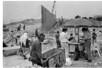
تصویر ۷- عکس از یک روز بارانی در خیابان‌های پاریس، عکاس: روبرت روانو، دهه ۱۹۶۰ میلادی

عکاسی خیابانی تأثیر عمیقی بر دیدگاه‌های اجتماعی و تصورات فرهنگی از زندگی شهری داشته و به‌عنوان ابزاری برای ثبت تغییرات اجتماعی و فرهنگی جوامع مورد استفاده قرار گرفته است. این نوع عکاسی می‌تواند در ترویج گردشگری فرهنگی نیز مؤثر باشد، چراکه تصاویر ثبت شده، زیبایی و پیچیدگی زندگی روزمره را به نمایش می‌گذارند و جاذبه‌های فرهنگی و اجتماعی هر جامعه را به گردشگران معرفی می‌کنند.