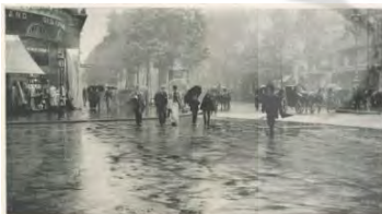
تصویر ۴- توجه به ساختار هندسی در عکس‌ها، خطوط آرام و

استفاده از سایه‌ها به‌صورت نقطه مانند در شهر، عکاس: پل