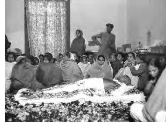
تصویر ۵- عکس مهاتما گاندی، عکاس: هانری کارتیه از مجموعه هند و مرگ مهاتما گاندی، سال ۱۹۴۸ میلادی