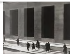
تصویر ۳- استفاده از عناصر جوی مانند دود، گردوغبار، باران و