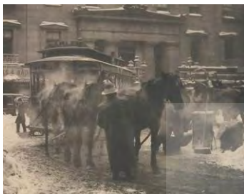
تصویر ۲- عکس ترمینال، عکاس: آلفرد استیگلیتز، ۱۸۹۳

عکاسان خیابانی در نمایش زندگی اجتماعی و تأثیر آن بر شکل‌دهی افکار عمومی پرداخته است. رز ۱ (۲۰۲۲، ۲۰۱۴) نیز رابطه میان عکاسی خیابانی و هویت اجتماعی را مورد تحلیل قرار داده و عکس‌های خیابانی را منعکس‌کننده و شکل‌دهنده هنجارهای اجتماعی و فرهنگی دانسته‌اند. افزون بر این شوارتز و رایان ۲ (۲۰۲۱) نیز ضمن بررسی نقش عکاسی خیابانی در هنر معاصر، عکاسی خیابانی را به‌عنوان ابزاری جهت نقد فرهنگی و اجتماعی تعریف کرده‌اند. در این خصوص مک اینتایر ۳ (۲۰۰۳) عکاسی خودکار و تأثیر آن بر رویه‌های اجتماعی و فرهنگی جامعه را مورد تحلیل و ارزیابی قرار داده و ضمن بهره‌گیری از عکس‌های تاریخی جهت درک تغییرات اجتماعی و فرهنگی در طول زمان، به تحلیل این مهم نیز پرداخته است. همچنین رجبی نژاد مقدم پاپکیاده و روحانی (۱۴۰۱) نیز در بررسی نقش عکاسی خیابانی در دوران انقلاب و جنگ در ایران و تأثیر این مهم بر ساختارهای سیاسی، اجتماعی و فرهنگی جامعه، بیان داشتند که عکاسی خیابانی در این دهه ضمن اثربخشی مؤثر بر هریک از وجوه نام‌برده، نمایانگر تعاملی میان هنر عکاس و جریان‌ات حاکم بر جامعه بوده و عکاسی مستند و خیابانی در این دوره پیوندی ناگسستنی یافته‌اند. در حقیقت عکاسی متناسب با جریان‌ات سیاسی، اجتماعی و فرهنگی قادر است؛ روح زمانه خویش را بازتاب دهد (رجبی نژاد مقدم پاپکیاده، ۱۴۰۲).