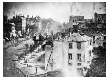
تصویر ۱- عکس معبد بولوار، عکاس: لوئیس داگر، سال ۱۸۳۸