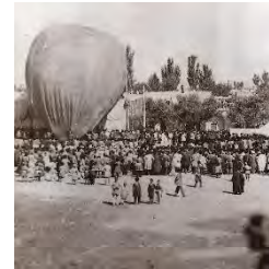
تصویر ۹- عکس پرواز بالن در شهر تبریز