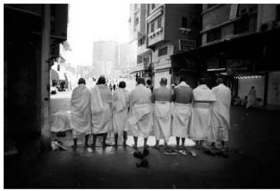
تصویر ۱۲- عکس مراسم حج در مکه، عکاس: نیوشا توکلیمان ۲۰۰۹ میلادی