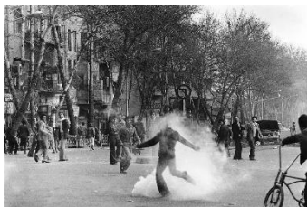
تصویر ۱۰- عکس از مجموعه انقلاب

و رابرت فرانک ۱ با کتاب «آمریکایی‌ها» از برجسته‌ترین عکاسان این دوره بودند (Haworth-Booth, 2003; Greenough & Alexander, 2009). در فرانسه، عکاسان نظیر روبرت دوینزو و ویلی رونیس و در انگلستان، راجر ماین و دایدو موریاما از جمله چهره‌های برجسته‌ای بودند که زندگی روزمره مردم را به تصویر کشیدند (Hamilton, 2001; Vestberg, 2011). در دهه‌های ۱۹۶۰، عکاسی خیابانی در ایالات متحده با آثار گری وینوگراد رونق یافت (Dyer, 2016; Mitchell, 2012). در دهه‌های ۱۹۸۰، ۱۹۹۰ و ۲۰۰۰، عکاسی خیابانی با ظهور تلفن‌های هوشمند و رسانه‌های اجتماعی مانند اینستاگرام و توییتر تحولات بسیاری را تجربه کرد (Hostetler, 2014; Cromer, 2019). در ایران، عکاسی خیابانی با دوران قاجار آغاز شد و در دهه‌های بعد به شکوفایی رسید (خدادادی مترجم زاده، ۱۳۹۱). کاوه گلستان با ثبت تصاویر خیابانی از دوران انقلاب اسلامی و جنگ تحمیلی از چهره‌های برجسته این ژانر است. آثار وی تصاویری واقعی و تأثیرگذار از زندگی مردم را به نمایش گذاشت. در دهه‌های اخیر، نیوشا توکلین و عباس عطار نیز به عکاسی خیابانی پرداخته و نگاهی جدید به زندگی شهری و فرهنگ ایران ارائه داده‌اند (رجبی نژاد مقدم پاکباده و روحانی، ۱۴۰۱).