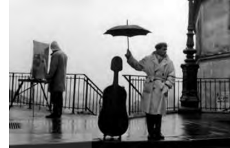
تصویر ۷- عکس از یک روز بارانی در خیابان‌های پاریس، عکاس: روبرت روانو، دهه ۱۹۶۰ میلادی

و رابرت فرانک ۱ با کتاب «آمریکایی‌ها» از برجسته‌ترین عکاسان این دوره بودند (Haworth-Booth, 2003; Greenough & Alexander, 2009). در فرانسه، عکاسان نظیر روبرت دوینزو و ویلی رونیس و در انگلستان، راجر ماین و دایدو موریاما از جمله چهره‌های برجسته‌ای بودند که زندگی روزمره مردم را به تصویر کشیدند (Hamilton, 2001; Vestberg, 2011). در دهه‌های ۱۹۶۰، عکاسی خیابانی در ایالات متحده با آثار گری وینوگراد رونق یافت (Dyer, 2016; Mitchell, 2012). در دهه‌های ۱۹۸۰، ۱۹۹۰ و ۲۰۰۰، عکاسی خیابانی با ظهور تلفن‌های هوشمند و رسانه‌های اجتماعی مانند اینستاگرام و توییتر تحولات بسیاری را تجربه کرد (Hostetler, 2014; Cromer, 2019). در ایران، عکاسی خیابانی با دوران قاجار آغاز شد و در دهه‌های بعد به شکوفایی رسید (خدادادی مترجم زاده، ۱۳۹۱). کاوه گلستان با ثبت تصاویر خیابانی از دوران انقلاب اسلامی و جنگ تحمیلی از چهره‌های برجسته این ژانر است. آثار وی تصاویری واقعی و تأثیرگذار از زندگی مردم را به نمایش گذاشت. در دهه‌های اخیر، نیوشا توکلین و عباس عطار نیز به عکاسی خیابانی پرداخته و نگاهی جدید به زندگی شهری و فرهنگ ایران ارائه داده‌اند (رجبی نژاد مقدم پاکباده و روحانی، ۱۴۰۱).