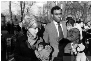
تصویر ۸- باغ وحش سنترال پارک نیویورک ۱۹۶۴ میلادی