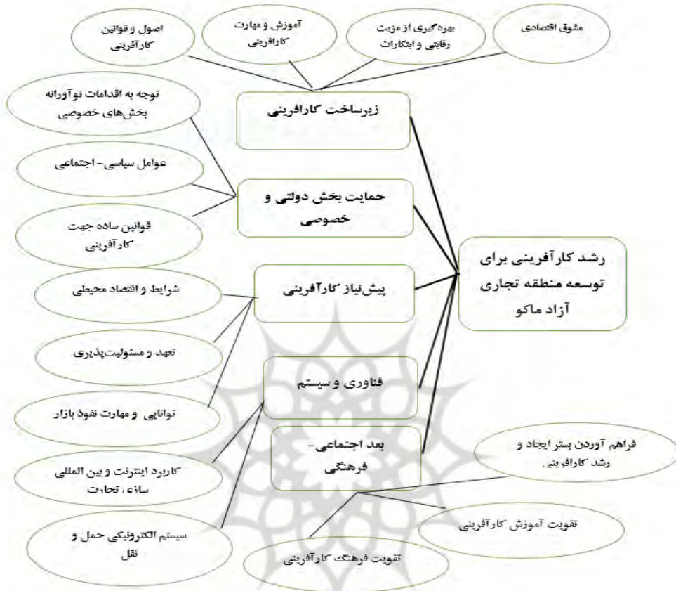
شکل ۱- مدل رشد کارآفرینی برای توسعه مناطق آزاد بر اساس تامین منافع جامعه محلی