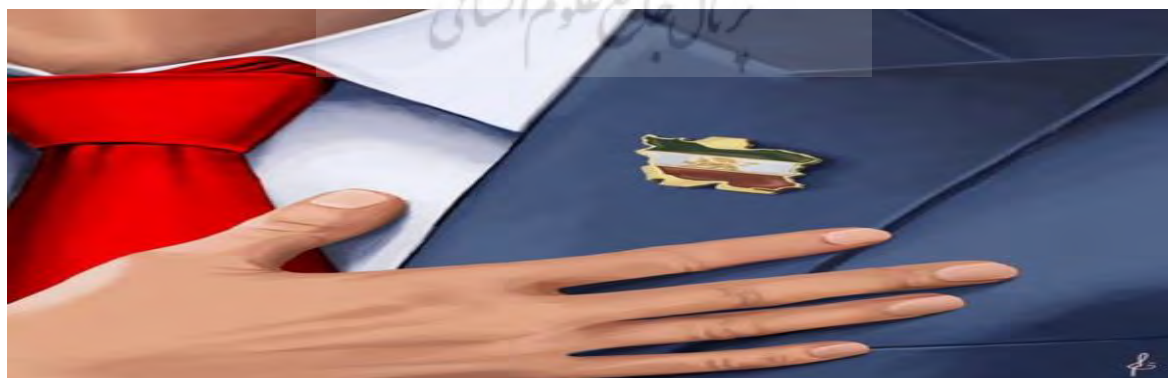
تصویر ۴ عکس نمادین منتشر شده در صفحه سلبریتی مرد در مورد نقش‌آفرینی رضا پهلوی

اما از آنجایی که این اقدام نمایشی از روی عدم تخصص و آگاهی کافی این سلبریتی‌ها از دانش سیاست بود می‌توان در نگاه اول به موضوع پی برد که هیچ یک از دموکراسی‌ها و نظام‌های انتخاباتی در جهان، مسئله نمایندگی از طریق اعطای وکالت را قبول ندارند و فقط بر انتخابات آزادانه و رقابت تأکید دارند. دومین مطلب که در اینجا به شدت نمایان است انتخاب یک