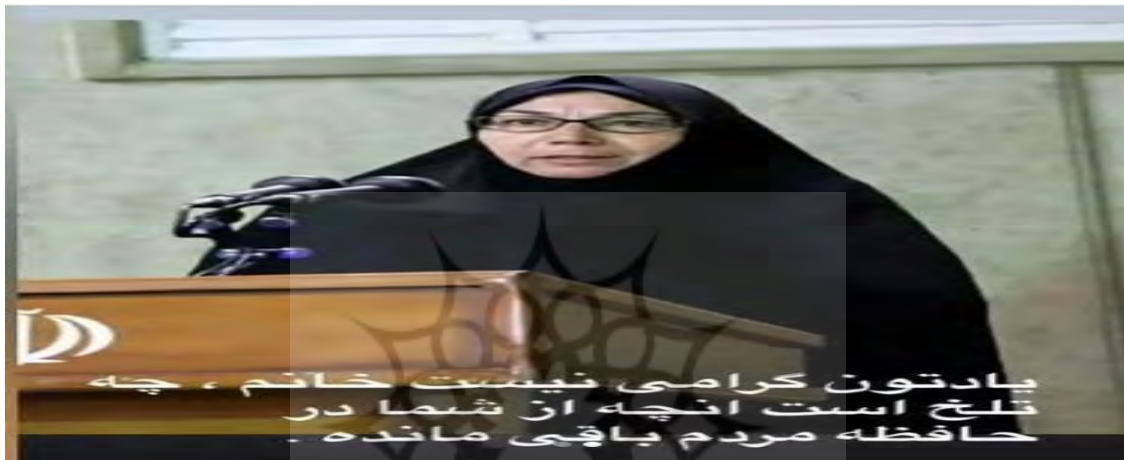
تصویر ۱ پست اینستاگرام بازیگر مرد ایرانی در واکنش به مرگ یک سلبریتی زن دیگر

جریان سیاسی خاص را مورد نقد قرار دهد و همزمان از طریق نفی کارنامه سیاسی و هنری آن سلبریتی، به نمایش دیدگاه خود بپردازد. به عبارت دیگر، از منظر گفتمان زبان‌شناسی این نفی به مثابه تأیید مستتر می‌تواند در نظر گرفته شود. در این چارچوب ارزش‌های مورد نظر سلبریتی مرد منتشر کننده تصویر پروانه معصومی به صورت مستقیم از طریق دیگرسازی از باورها و ارزش‌های مورد احترام سلبریتی دیگری که تصویر او منتشر شده است برای تأیید مخاطبان در معرض نگاه آنان قرار گرفته است. در اینجا دیگری به مثابه فردی در نظر گرفته می‌شود که از نظر هویتی در چارچوب گروه ما قرار نمی‌گیرد. دیگری همواره از نظر هویتی، سبک زندگی ارزش‌ها و رویکردها در نقطه مقابل ما قرار می‌گیرد. از همین رو تأکید بر تفاوت و تمایز او است که نشان دهنده آن است که در اینجا ارزش‌های دیگری وجود دارند که باید بر روی آن تأکید داشت. به این ترتیب در اینجا بازنمایی دیگری، روشی برای رسمیت بخشیدن به هویت و اندیشه‌ای است که از آن «ما» قلمداد می‌گردد.