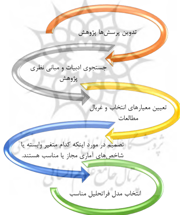
نمودار ۱. مراحل انجام فرا تحلیل (Borenstein et al., 2021)

با توجه به اینکه هدف از این پژوهش طراحی مدل قابلیت‌های پویای کارکنان سازمان با رویکرد چابکی فکری است؛ بنابراین روش پژوهش برحسب هدف، اکتشافی-کاربردی؛ برحسب زمان گردآوری داده از نوع مقطعی، از نظر فلسفی استقرایی-قیاسی و برحسب روش گردآوری داده‌ها و یا ماهیت و روش پژوهش، پیمایشی است. به‌منظور انجام پژوهش از روش فرا تحلیل استفاده شده است.