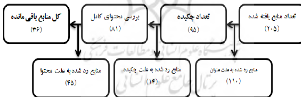
شکل شماره ۲: فرآیند جستجو، مرور و انتخاب منابع

فرآیند جستجو، مرور و انتخاب منابع در شکل زیر آمده است.