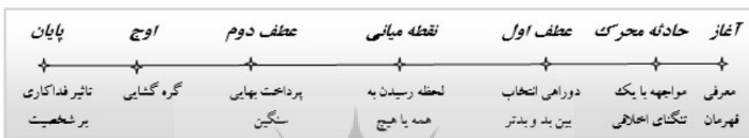
تصویر شماره ۱: کهن‌الگوی پی‌رنگ «فداکاری»

در بسیاری از این‌گونه داستان‌ها، فداکاری آنی و شهودی است و چرخش دراماتیک خوبی ایجاد می‌کند. اما مشاهده درگیری شدید درونی کسی که باید تصمیمی بگیرد، مخاطب را بیشتر به هیجان می‌آورد؛ چرا که توصیف این شخصیت‌ها با جزئیات واقعیت‌نمایانه، ما را به یاد انسان‌های واقعی در جهان پیرامونمان می‌اندازند (پاینده، ۱۳۸۹، ج ۳: ۶۶). در نهایت شخصیت داستان، خود را برای یک آرمان قربانی می‌کند. بهای سنگینی چون تغییرات روحی عمیق و یا حتی به قیمت زندگی‌اش می‌پردازد و به یک دگرگونی بزرگ تن می‌دهد. در تصویر شماره ۱ کهن‌الگوی پی‌رنگ «فداکاری» آمده است.