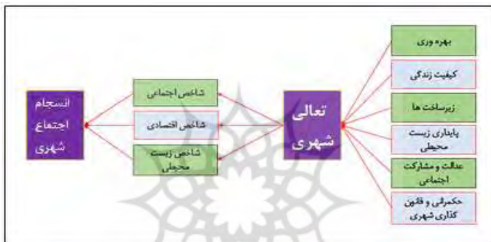
شکل شماره ۱- مدل مفهومی پژوهش

محیط زیست. اقتصاد به عنوان ارائه دهنده شغل‌ها و درآمد، برای سلامت مردم (توانایی آن‌ها در تأمین غذا، لباس و مسکن) و ارائه نیازهای سطوح بالاتر مانند آموزش، بهداشت و تفریحات بسیار حیاتی است. همچنین، استفاده اقتصادی باید به گونه‌ای باشد که از موجودیت منابع محیط زیست برای نسل‌های حال و آینده بهره‌برداری مسئولانه‌ای داشته باشد. به طور مشابه، بهزیستی اجتماعی به توزیع عادلانه و اجتماعی منابع اقتصادی و محیط زیستی وابسته است: آزادی فردی و فرصت‌های برابر، از اجزای اساسی تشکیل‌دهنده برای انعکاس زندگی اجتماعی است. در نهایت، محیط زیست به عنوان زیرساختی برای ارائه منابع طبیعی، ظرفیت دفع زباله و حفظ تعادل بین انسان و محیط طبیعی تأکید دارد [۲۲]. در (شکل شماره ۱)، مدل مفهومی این تحقیق نمایش داده شده است.