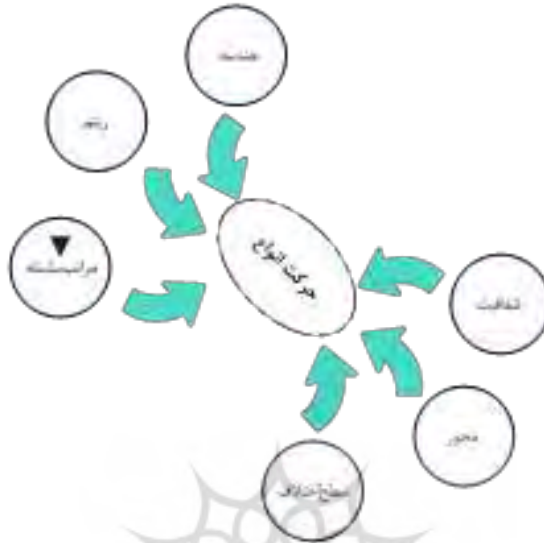
شکل ۳: عوامل حرکت در رویاروی با تعاملات فرهنگی در رابطه با مسیر پژوهش

می‌آورد (گودرزی، کشاورز، ۱۳۸۶: ۱۰۱-۸۹). برپایه (شکل ۳)، می‌توان عوامل حرکت در رویاروی با تعاملات فرهنگی متصور شد.