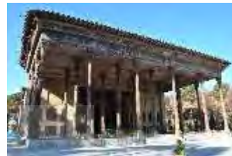
باغ چهل ستون؛ اصفهان