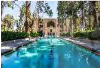
باغ فین؛ کاشان