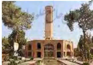
باغ دولت‌آباد؛ یزد