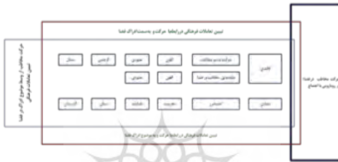
شکل ۲: تبیین انواع حرکت مخاطب در فضا در رابطه با اجتماع تعاملات فرهنگی- (مأخذ: نگارندگان، ۱۴۰۳)

همه نظریه پردازان وجود دارد حذف مضمون داستانی و جایگزین کردن پیام در رویارویی با تعاملات فرهنگی است. اگر به تعریف نسبتاً واحدی از روایت با تبیین مطالعات اجتماعی قائل بشویم می توان از آن به باز نمود مفاهیم، رخدادها، حوادث و اجزایی تعبیر کرد که به نحوی با یکدیگر پیوندهای درونی و بیرونی و زمانی و مکانی و فضایی دارند. طوری برپایه (شکل ۲)، انواع حرکت مخاطب در فضا را نشان می دهد.