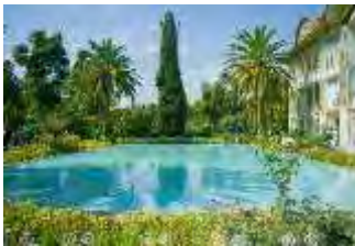
باغ ارم؛ شیراز