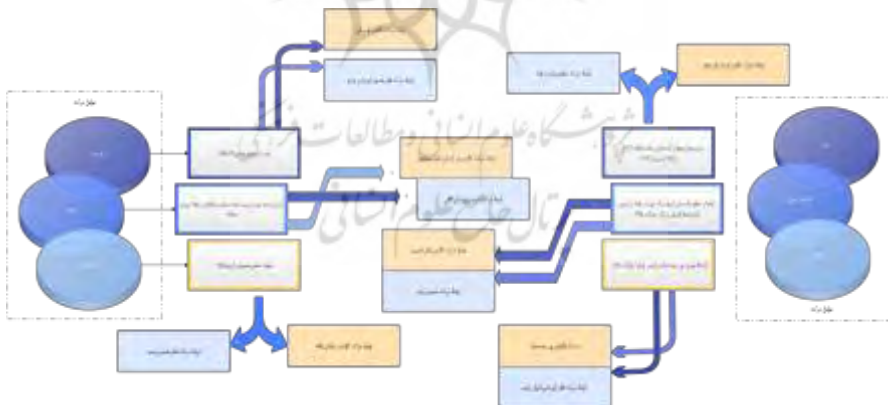
شکل ۴: عوامل حرکت و نقش کالبدی و چشمی آن با تعاملات فرهنگی در رابطه با مسیر پژوهش (مأخذ: برداشت نگارندگان، ۱۴۰۳)

← برآیند محقق بر تعاملات فرهنگی و مؤلفه حرکتی در ساختار روایی باغ‌ایرانی: تحلیل مؤلفه‌های حرکتی در ساختار روایی باغ ایرانی با رویکرد تعاملات فرهنگی، نیازمند بررسی چگونگی تأثیرپذیری باغ‌ها از تعاملات فرهنگی مختلف در طول تاریخ است. باغ‌های ایرانی نه تنها به‌عنوان مکانی فیزیکی، بلکه به‌عنوان محیط‌هایی پویا و متعامل که در ول زمان تحت تأثیر فرهنگ‌های مختلف شکل گرفته‌اند، مورد توجه قرار می‌گیرند. در این راستا، پژوهش‌های دسته‌بندی شده به‌ما کمک می‌کنند تا مؤلفه‌های حرکتی را در ساختار روایی باغ‌های ایرانی بهتر درک کنیم و چگونگی تأثیرات فرهنگی مختلف بر این ساختارها را مورد بررسی قرار دهیم. هردسته از پژوهش‌ها، جنبه‌ای از تعاملات فرهنگی را برجسته می‌کند که در کنارهم تصویر جامعی از باغ‌ایرانی و رویکردهای مختلف به آن را فراهم می‌آورد. برپایه (شکل ۴)، می‌توان عوامل حرکتی و نقش فیزیکی (کالبدی)، و چشمی آن‌را عنوان داشت.