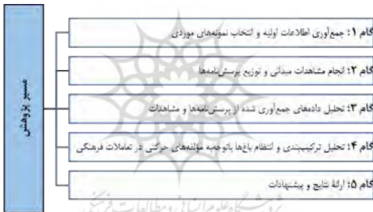
شکل ۱: مسیر پژوهش

حسی در این فضاها بپردازند و تأثیر این عناصر بر تجربه کلی بازدیدکنندگان را ارزیابی کنند. ترکیب تحلیل‌های کیفی و توصیفی-تحلیلی و نیز مشاهدات میدانی، نه تنها به درک بهتری از نحوه طراحی و ساختار باغ‌های ایرانی کمک می‌کند، بلکه نقش این مؤلفه‌ها در ایجاد یک تجربه فضایی معنادار و پویا را نیز برجسته می‌سازد. با تبیین این روش تحقیق، می‌توان به نتایجی دست‌یافت که نشان‌دهنده اهمیت حرکت و جابه‌جایی در این فضاها و تأثیر آن بر ارتباط بازدیدکنندگان با محیط و فرهنگ موجود در باغ‌هاست. این پژوهش با بهره‌گیری از روش‌های تحقیق کیفی و ابزار پرسش‌نامه، سعی دارد تا تأثیر مؤلفه‌های حرکتی در باغ‌های ایرانی را با بهره‌گیری از رویکرد تعاملات فرهنگی بر تجربه و احساسات بازدیدکنندگان بررسی کند و به شناخت بهتری از نقش این عناصر در ایجاد یک فضای فرهنگی و تاریخی پویا ارج نهد. به‌طور خلاصه برپایه (شکل ۱)، می‌توان مراحل اجرایی مسیر پژوهش را مدنظر داشت.