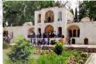
باغ شاهزاده ماهان؛ کرمان