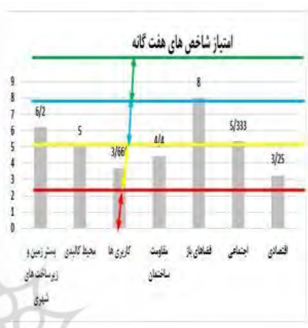
جدول ۷: امتیازات تاب‌آوری شهری در هر یک از محورهای هفت‌گانه در شهر بندرعباس