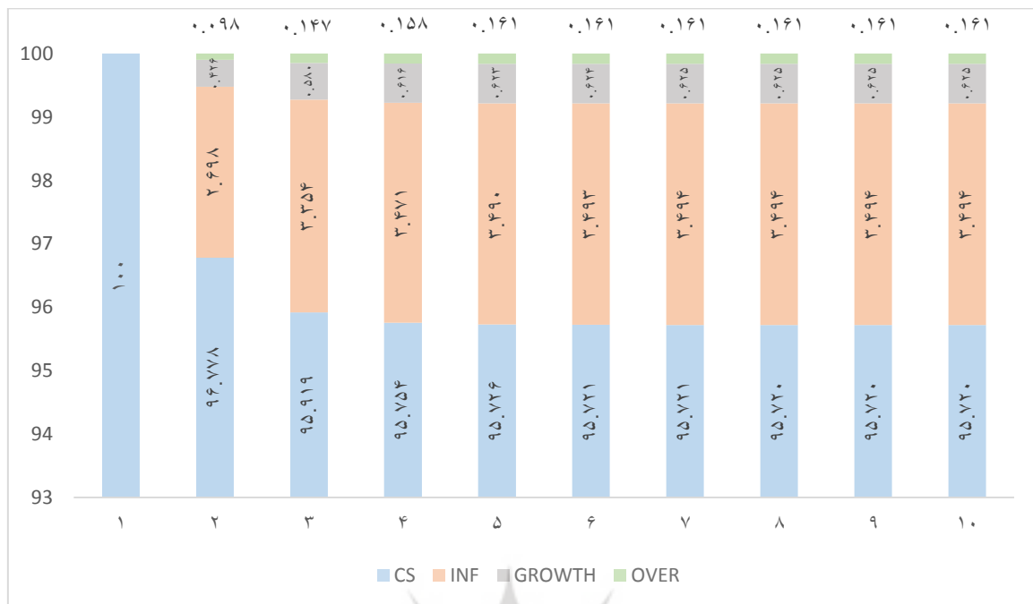
نمودار ۳. نتایج تجزیه واریانس جانشینی پول

همان‌طور که گفته شد، جهش‌های ارزی به‌طور مستقیم و غیرمستقیم (از کانال رشد اقتصادی و تورم) بر جانشینی پول در اقتصاد ایران اثر می‌گذارند، اما نتایج تجزیه واریانس نشان داد که آثار غیرمستقیم به‌ویژه از کانال تورم، دارای سهم بالاتر و ماندگارتری بیشتری در توضیح تغییرات جانشینی پول در اقتصاد ایران در مقایسه با اثر مستقیم و بدون واسطه خود جهش‌های ارزی بر جانشینی پول است.