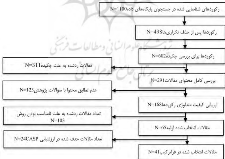
شکل ۱. فرایند انتخاب مقاله‌های نهایی

گام سوم: جستجو و انتخاب مقاله: برای گزینش مقاله‌های مناسب بر اساس شکل (۱) آیت‌های متفاوتی از جمله: عنوان، چکیده، محتوا، سوالات و روش‌شناسی پژوهش بررسی شده است. در نهایت ۶۵ مقاله با بازبینی دقیق متن‌ها انتخاب و بعد از بکارگیری معیار ارزیابی منتقدانه ۱ تعداد ۴۱ مقاله به عنوان مقاله نهایی انتخاب شد.