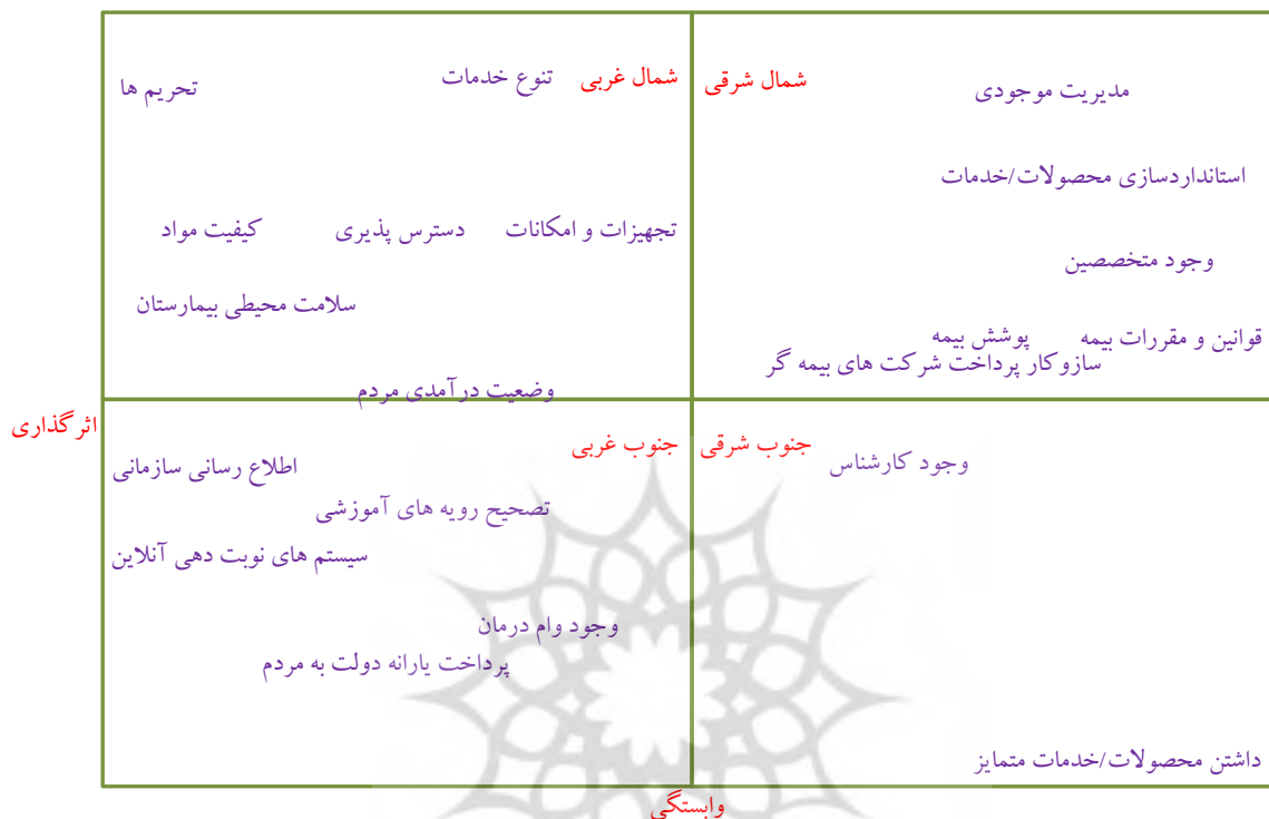
شکل ۱: پراکنندگی پیشران‌های تأمین مالی از طریق ارائه خدمات بر اساس تأثیرات مستقیم در زنجیره تأمین بهداشت و درمان ایران

نمودار جای می‌گیرند و طبیعت آن‌ها با عدم پایداری همراه است. متغیرهای وابسته که در قسمت جنوب شرقی نمودار قرار دارند، دارای تأثیرگذاری پایین و تأثیرپذیری بالایی هستند و بنابراین نسبت به تغییرات متغیرهای تأثیرگذار و