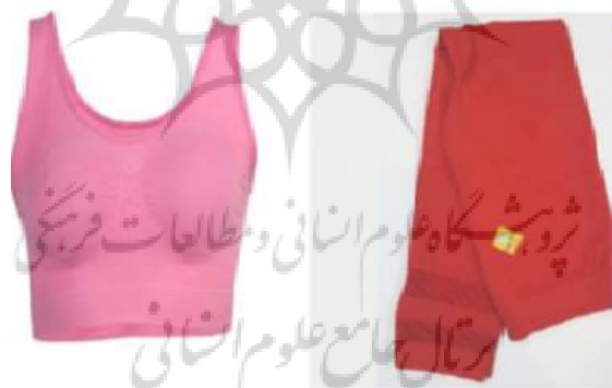
شکل ۱- نمونه‌ای از لباس‌های مورد استفاده در تحقیق

لباس‌های مذکور دارای ترکیبی شامل ۵۲ درصد نخ خنک‌کننده CoolMax پلی‌استر و ۴۸ درصد نخ ضدباکتری Nano silver و ZnO است.