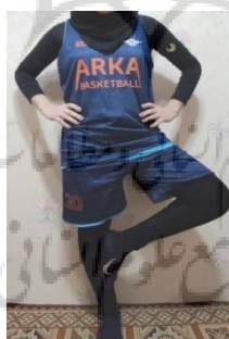
شکل ۳. ارزیابی تعادل ایستا

جهت ارزیابی تعادل ایستا از تست فلامینگو (ایستادن روی پای برتر با چشمان بسته) با پایایی درون آزمونگر خوب (۰/۹۹ تا ۰/۸۷) و پایایی باز آزمایی ضعیف تا خوب (۱ تا ۰/۵۹) استفاده شد. در این آزمون شرکت کننده بر روی پای ترجیحی خود ایستاده و دست ها را در ناحیه کمر قرار داد. سپس پای دیگر به اندازه تقریباً ۱۰ سانتیمتر از سطح مورد نظر (زمین) جدا شده و با ارائه محرک فرد، چشمان خود را باید ببندد. نمره تعادل ایستای این فرد با مقدار زمانی که پای خود را بالا نگه داشته و یا تعادل فرد دچار اختلال نشده به دست آمد (شکل ۳) (۲۵).