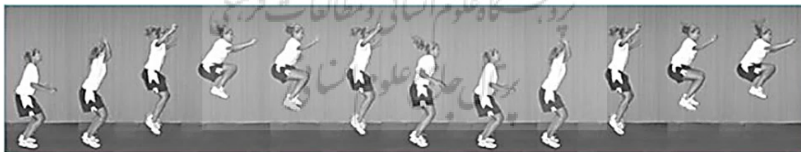
شکل ۱. تست پرش تاک (۳۳)

در این پژوهش قد آزمودنی‌ها با قدسنج و وزن آن‌ها از ترازوی دیجیتال استفاده شد. جهت ارزیابی نقص تنه از تست پرش تاک با پایایی بین آزمونگر (۹۳/۱) و پایایی درون آزمونگر (۸۷/۱) استفاده شد. در این آزمون فرد با پاهای باز به اندازه عرض شانه می‌ایستد و به صورت عمودی شروع به پرش می‌کند و زانوهای خود را تا حد امکان بالا می‌آورد. در بالاترین نقطه پرش، ران‌ها موازی با زمین قرار می‌گیرند. بلافاصله بعد از فرود، فرد باید پرش تاک بعدی را شروع کند. آزمودنی پرش تاک را به مدت ۱۰ ثانیه به صورت متوالی تکرار می‌کند. برای بهبود دقت ارزیابی از دو دوربین فیلمبرداری در دو نمای قدامی و جانبی استفاده شد، دوربین‌ها با فاصله سه متری از آزمودنی‌ها تنظیم شدند تا تصویر به صورت درشت‌نمایی شده برای بررسی در اختیار پژوهشگر قرار بگیرد، پس از انجام آزمون، برای بررسی سکانس‌های پرش، از نرم افزار کینوا استفاده شد فردی که قادر نباشد در محل شروع پرش خود فرود بیاید، در نقطه اوج پرش ران‌های موازی با زمین قرار نگیرد و پرش هایش در طول ۱۰ ثانیه با وقفه انجام گیرد، به عنوان فرد دارای نقص تنه در نظر گرفته شد (۱۸). هر آزمودنی سه بار با آزمون پرش ارزیابی شد و میانگین امتیازات ورزشکاران ثبت شد تا افراد مبتلا به نقص عصبی - عضلانی و به خصوص نقص تنه شناسایی شوند (شکل ۱) (۱۸).